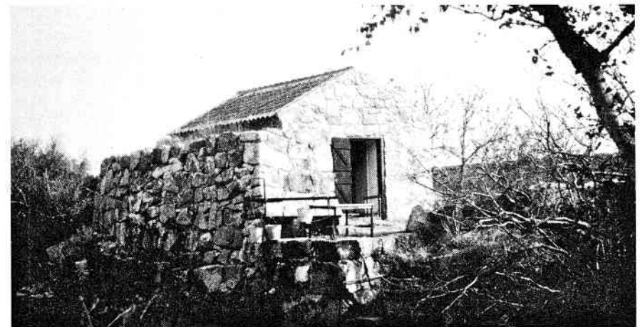
Fuglestationen på Christiansø

Trækfugleforskningen på Christiansø er af nyere dato. Først da spejlnettene kom frem, var der et effektivt redskab til systematisk fangst af småfugle, og småfugleringmærkningen kom for alvor i gang omkring 1970. Den systematiserede ringmærkning påbegyndtes dog først i