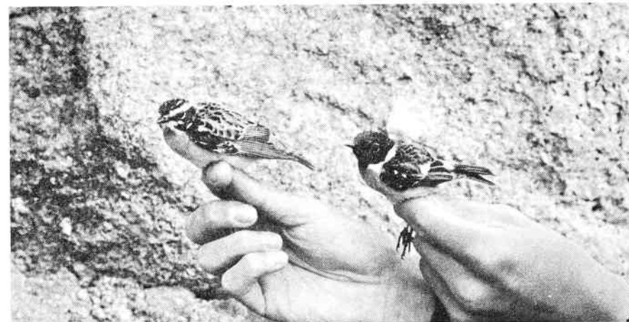
Bynkefugl han og Sortstrubet Bynkefugl han, Christiansø, maj 1997