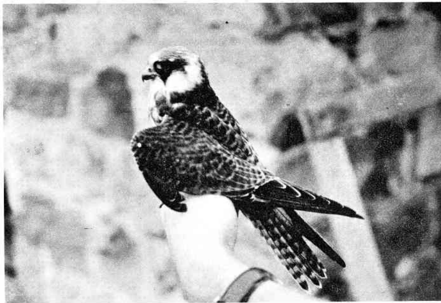
1k Aftenfalk, Christiansø, september 1997

Juni kom, og nogle dage inde i måneden gik vinden i sydøst. Dette gav pote. Den 5. kunne jeg med rystende fingre pille Christiansøs 12. Buskrørsanger ud af et af nettene, og samme dag dukkede årets første, og længe ventede, Lundsanger op. Buskrørsangeren blev på øen og sang flittigt i flere uger; mere kortvarigt var besøget af en artsfælle, der sad og sang på Frederiksvø 6. juni. For Lundsangerne blev det det helt store forår. Hele 13 eks. fik ring på i juni, og 3 par blev på øen og yngede med stor succes. Også to Engsnarrer blev hørt i starten af juni, men de var af den knap så publikumsvenlige type, og kun enkelte gange lykkedes det at høre et par "crex". Fangstmæssigt blev juni ikke nogen stor måned. Kun godt 400 fugle blev fanget i løbet af de første par uger, og den 16. kunne jeg