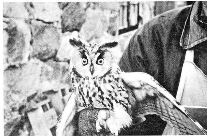
Skovhornugle, Christiansø, oktober 1997

blandt de mange Sølvmåger. Først omkring månedsskiftet kom der nogle pæne fangstdage med 4-500 fugle, domineret af Løvsanger, Broget Fluesnapper og diverse Sylvia -sangere, og den 3. september sad en ung Aftenfalk pludselig i et af nettene. Vi kom dog snart ned på jorden igen. Stort set resten af september bød på vestenvind, og da det er nordøstlige vinde, der giver mange fugle på øen om efteråret, havde vi ikke meget at glæde os over. Rødhalse og Fuglekonger kom så småt i gang i løbet af september, men nåede ikke de store tal. Den største oplevelse i september var nok Tranerne. Næsten 2000 blev det til, heraf to dage med hver 800 fugle. Oktober bød på lidt mere varieret vejr, og efterårets største dag faldt 6. oktober med 609 mærkede fugle, heraf Rødhals 296 og Fuglekonge 203. For begge disse arter blev det et af