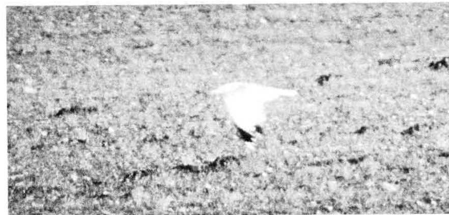
Adult Middelhavssølvmåge, Nyborg, januar 1998

En sen Husrødstjert rastede på Stige Ø 27/11 (THH), og campingpladsen på Flyvesandet husede 25/1 foruden Grønspætten også 13 Store Korsnæb (MMJ). Laplandsværpling er set 3 steder: 1 Viggelsø 8/12 (KDJ), 1 Helnæs Made 15-17/12 (MMJ, SG) og 1 Dalby Bugt 1/1 (KL, MRP).