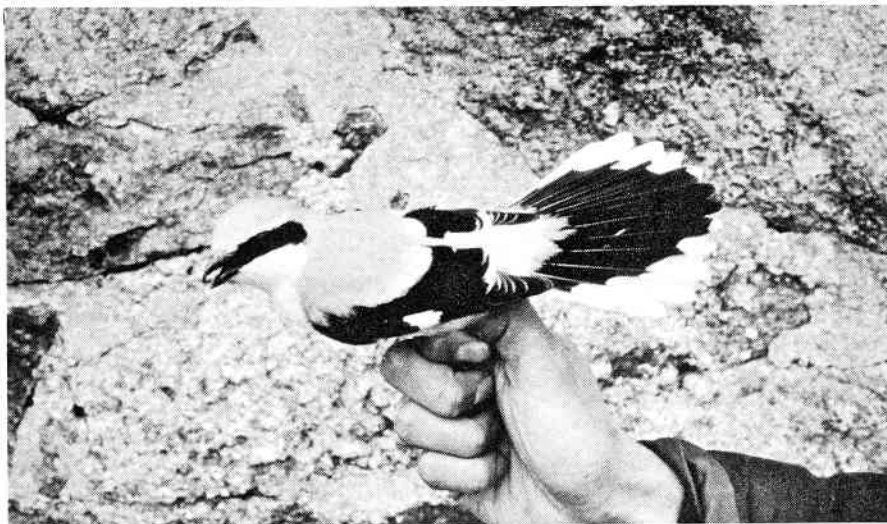
Stor Tornskade, Christiansø, april 1997

og aflæst, og om eftermiddagen stod en Gråmåge på havnen. Dette var samtidig starten for en rigtig god periode, og i løbet af den næste måned mærkede vi næsten 8000 fugle. Denne tid bød selv-sagt på adskillige højdepunkter. Rødhalsene kulminerede den 28-30. april; ud af 1532 mærkede på disse tre dage tilhørte hele 80% denne art. Få dage senere var scenen overtaget af Løvsangere, Rødstjerte og Brogede Fluesnappere. Den 6. maj, der med 853 mærkede blev forårets største dag, var Løvsanger således klart den talrigeste med 403, fulgt af Br. Fluesnapper 165, Rødhals 99 og Rødstjert 95. På det tidspunkt var de første hits allerede hevet i land: To Husskader, der rastede 1.-3. maj, udgjorde således blot det tredje fund på øen. Mere efter standarden var de to flotte hanner af Hvidhalset Fluesnapper, en rigtig Christiansø-specialitet, der blev fanget den 5. maj. Endnu en stor overraskelse var Fuglekongesangeren, som lod sig fange 8. maj; blot landets 3. forårsfund. Endnu en