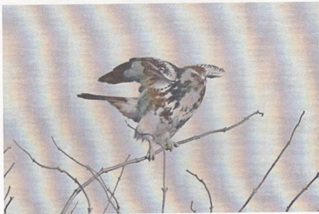
Lys Musvåge ved Brændegård Sø.

En art, som man let overser. Den kredser ikke over redestedet, og den ankommer først til ynglepladsen midt i maj, hvor træerne er sprunget ud. I de første par dage efter ankomsten kan man være heldig at se den i territorieflugt, hvor den kredser højt, dykker skråt og stiger og mens den basker med vingerne over ryggen med flyveskrig. Denne displayflugt behøver ikke at være over reden. Den pynter ikke sin rede, som Musvågen gør, så reden fremstår brun og visnen. I tørre somre med mange hvepse og