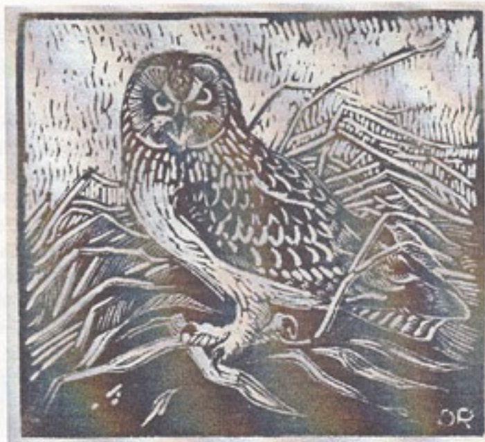
En af de mange Mosehornugler ved Fogense Enge vinteren 2005-2006