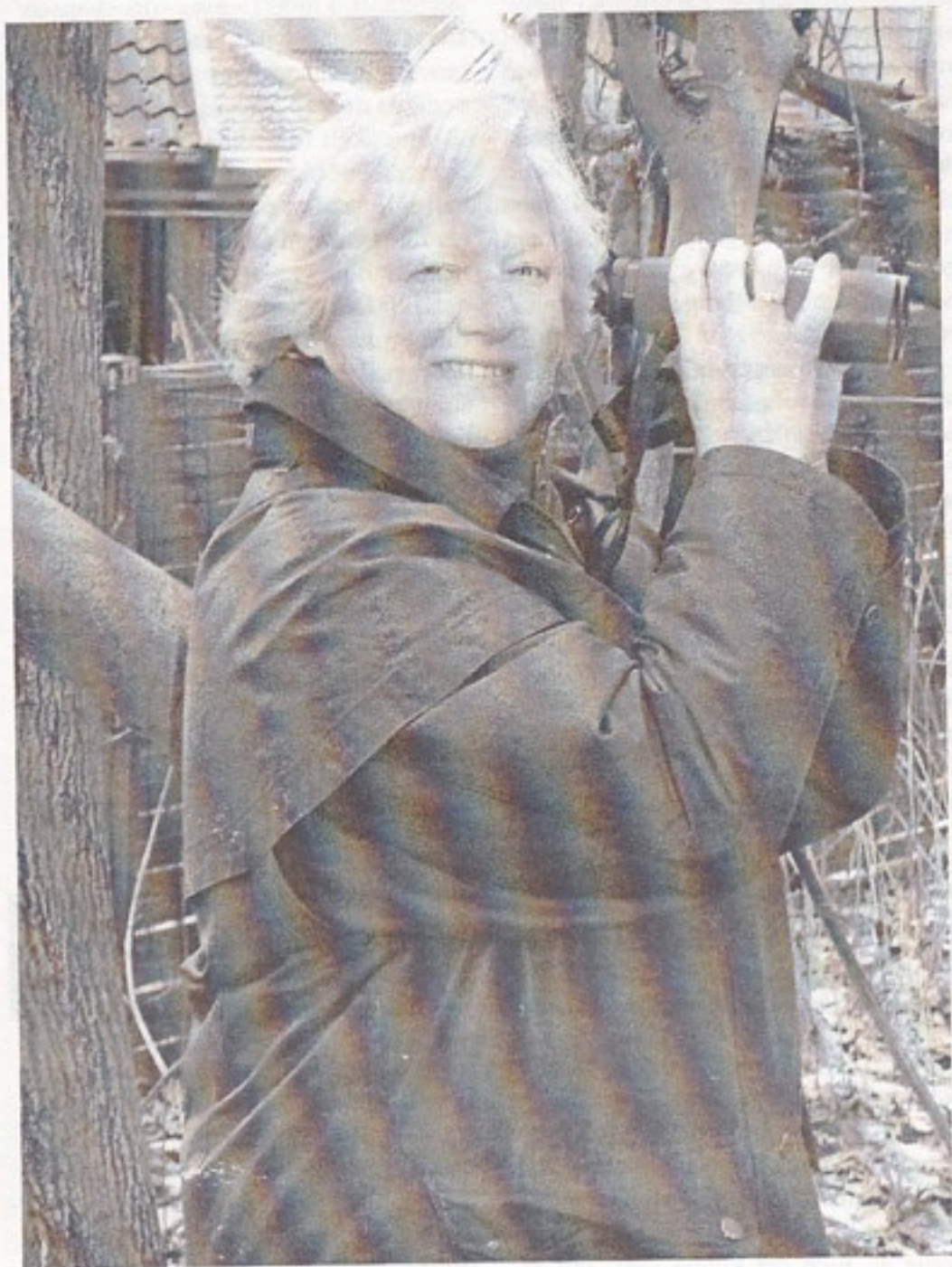
Ella i felten.