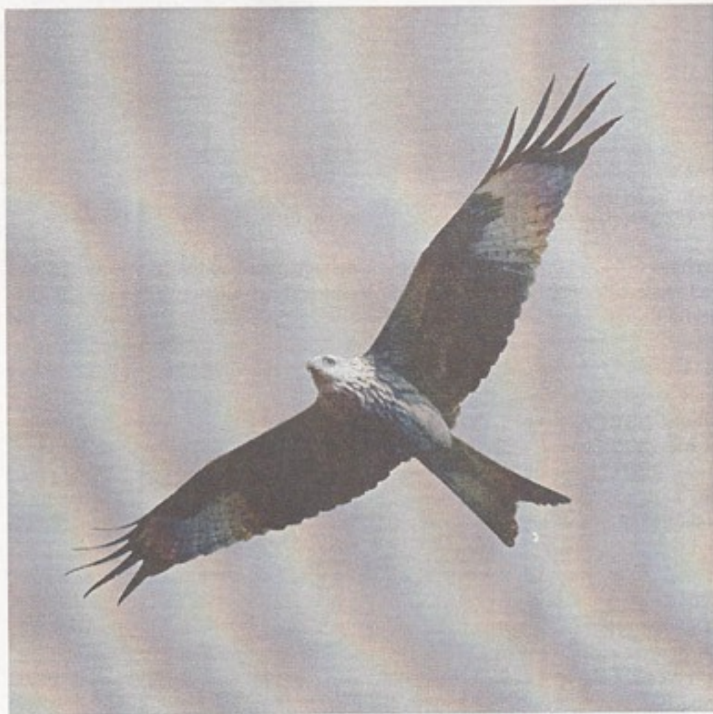
Rød Glente.

glenter og mange i forhold til artens ringe forekomst. Man kan håbe, at forbuddet mod at besidde giften Parthion vil trække i positiv retning. Rød Glente tåler ikke forstyrrelser på ynglepladsen. I perioden marts til september skal man ikke nærme sig reden – så forlader parret reden og kommer ikke tilbage.