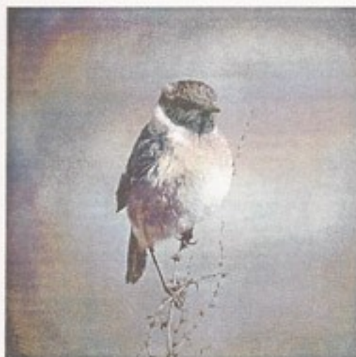
Sortstrubet Bynkefugl, Fyns Hoved.