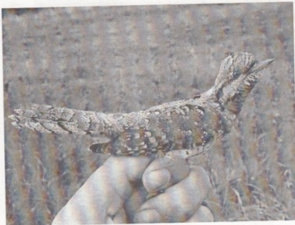
Vendehals. Keldsnor Fuglestation, august 2006.

Forklaring: Netmeter er længden af nettene i meter. Hver time én meter net har været åbent regnes som én netmetertime. Totalt fanger man altså 0,1 fugl (0,095 rundet op til 0,1) pr netmetertime, eller sagt på anden vis: Man skal have i gennemsnit have 10 meter net åbent i én time for at fange én fugl.