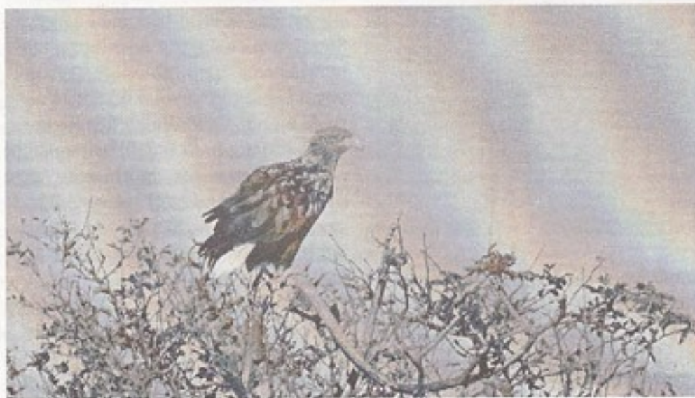
Havørn ved Brændegård Sø.