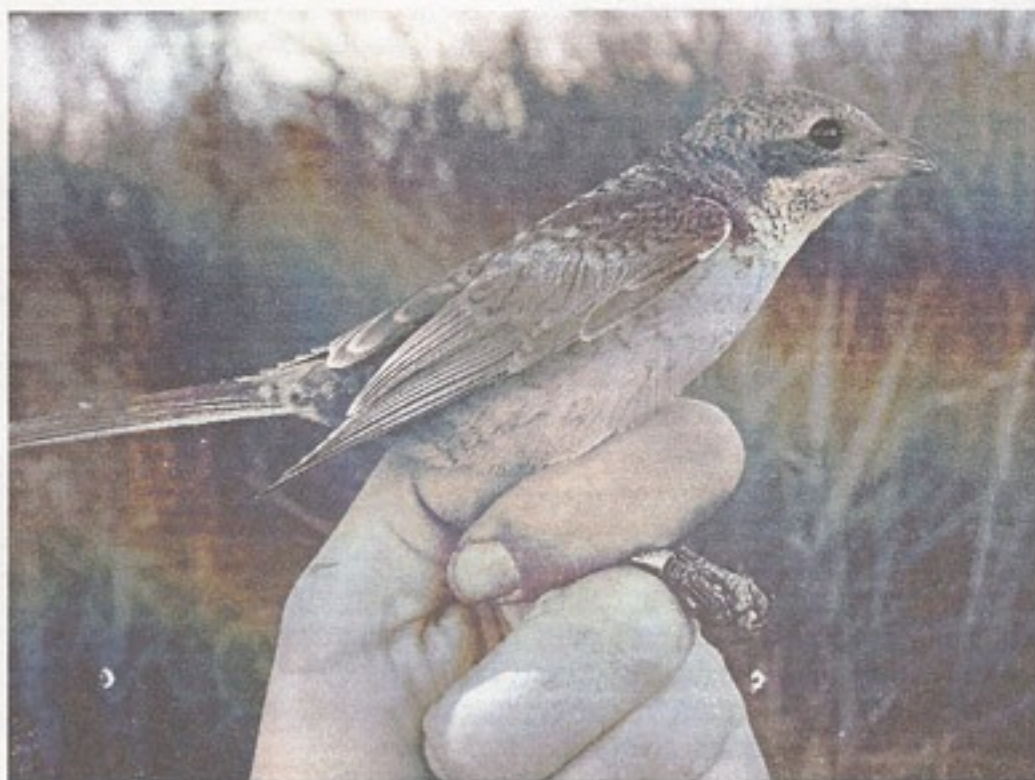
Ung Rødrygget Tornskade, Keldsnor Fuglestation august 2006.