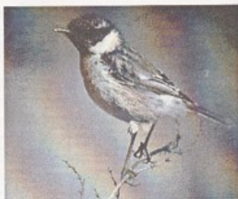
Sortstrubet Bynkefugl, Fyns Hoved.

31/3 1 han Måle Strand (RYT). 10/4 1 han Fyns Hoved (HEA, MMJ).