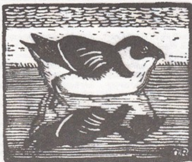
Denne Søkonge holdt til ved Bogense Havn i januar og februar 2006.