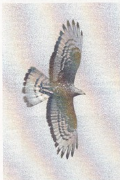
Hvepsevåge. Den mørke kant på vingebackanten viser, at det er en gammel fugl, de skarpt afsatte mørke fingerspidser og den store afstand mellem vingebackant og første mørke bånd på vingen at det er en han.

bier er der ynglesucces for 66% af parrene, i våde somre falder den til 45.3%. Hvis der ikke er hvepse nok tager Hvepsevågen padder og fugleunger. Gennem hele yngletiden lever Hvepsevågen diskret, de 100 par, der yngler i amtet er der vist ikke mange, der ser.