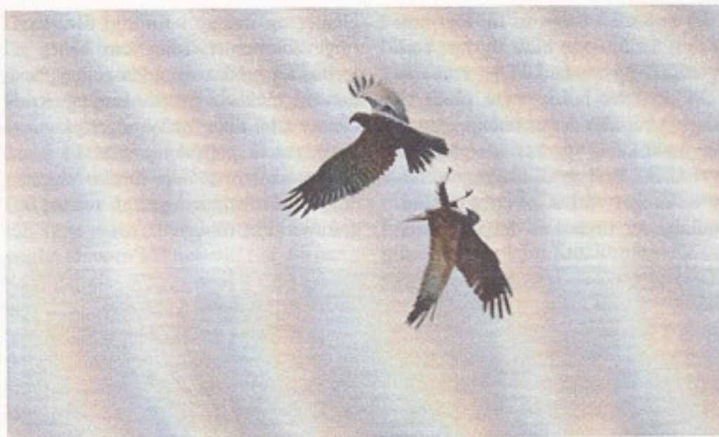
Rørhøgepar. Hannen afleverer bytte til hunnen.