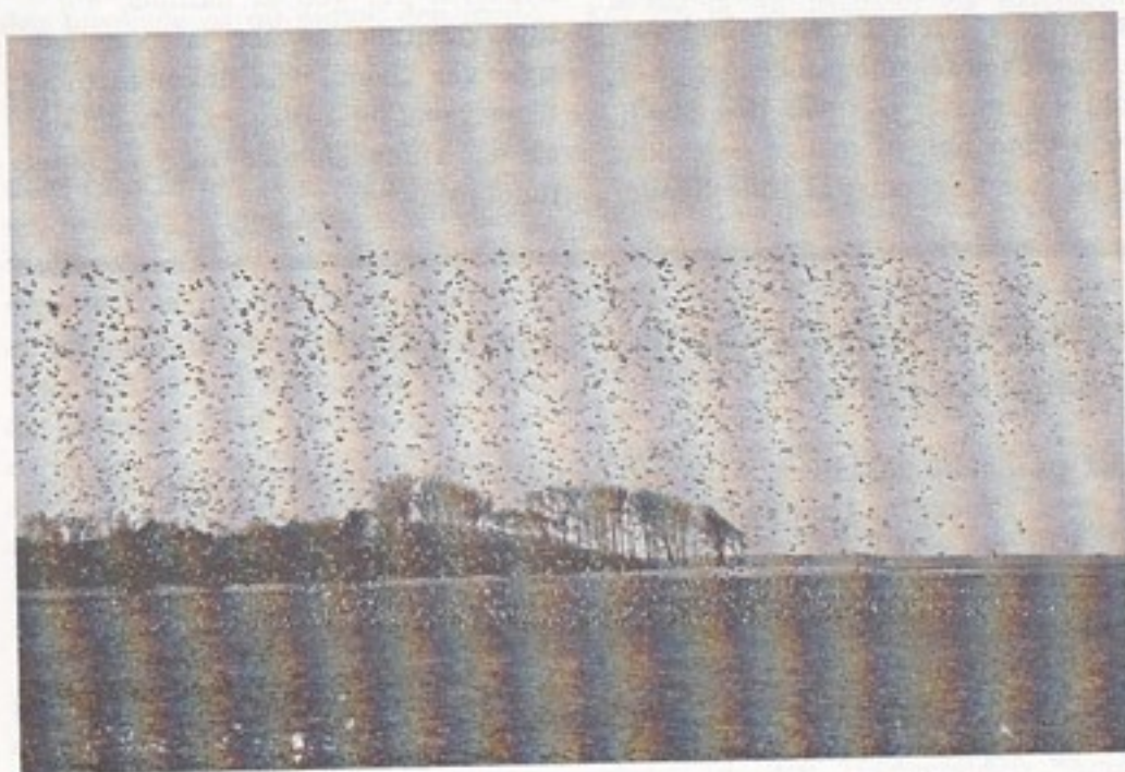
Bjergænder letter fra Bøjden Nor. Det står enhver frit for at kontrollere, at der er 5000.

isfrit, så man kunne glæde sig over de mange dykænder – Hvinand, Troldand, Taffeland – og ikke mindst 5000 Bjergænder. Som sædvanligt var der også lidt indslag af svømmeænder, bl.a. Krikand og Pibeand.