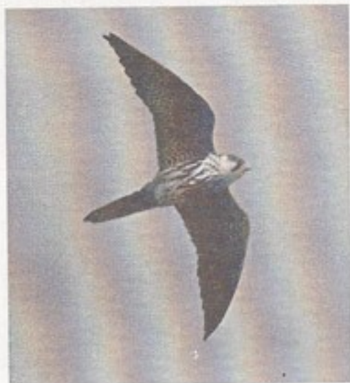
Lærkefalk med den karakteristiske flugtprofil.

En af landets sjældne ynglefugle, i 2005 registrerede man 15 par, heraf et fra Langeland. Arten er diskret på ynglepladsen og skal registreres ved ankomsten i maj – her kan man høre dem skribe ved redepladsen. Der er mange eksempler på at Lærkefalken forsøger sig og opgiver igen, blandt andet har der de seneste år været set fugle forår og ind i sommeren på Sydlangeland. Den har tidligere ynglet ved Fredmosen og i 80'erne ved Hasmark Mose. Der har dog altid været tale om isolerede tilfælde.