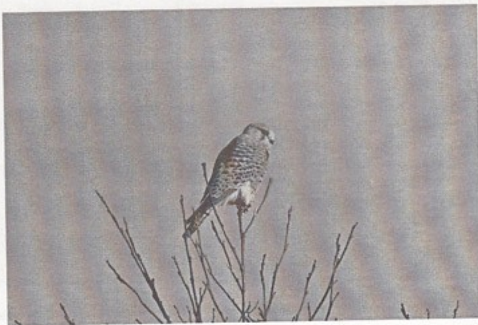
Tårnfalk. Brændegård Sø.

Denne elegante rovfugl, som mange ser, når den hænger og muser – i de senere år ofte langs motorvejen – yngler almindeligt i amtet med ca. 250 par. Den holder til i åbent land, 44.9% af bestanden holder til i bevoksninger på under 5 ha. Den yngler gerne i kasser, og opsætning af sådanne har hjulpet bestanden på gled i en del områder, hvor egnede ynglesteder er svære at finde. I områder med redekasser får Tårnfalken op til 4-5 unger pr. kuld. I perioder med fødevareoverskud kan Tårnfalken deponere føde til trange tider.