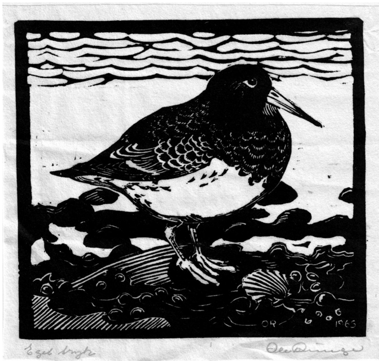
Sortgrå Ryle: Træsnit af Ole Runge.

kalenderår. Hollandske undersøgelser har vist, at kun 5% af 2k-fuglene og 8% af 3k-fuglene vender tilbage til yngleområdet. Det forhindrer ikke, at en del 2- og 3k-fugle trækker nordpå om foråret. Alligevel må man forvente at se en vis overvægt af helt unge og gamle fugle.