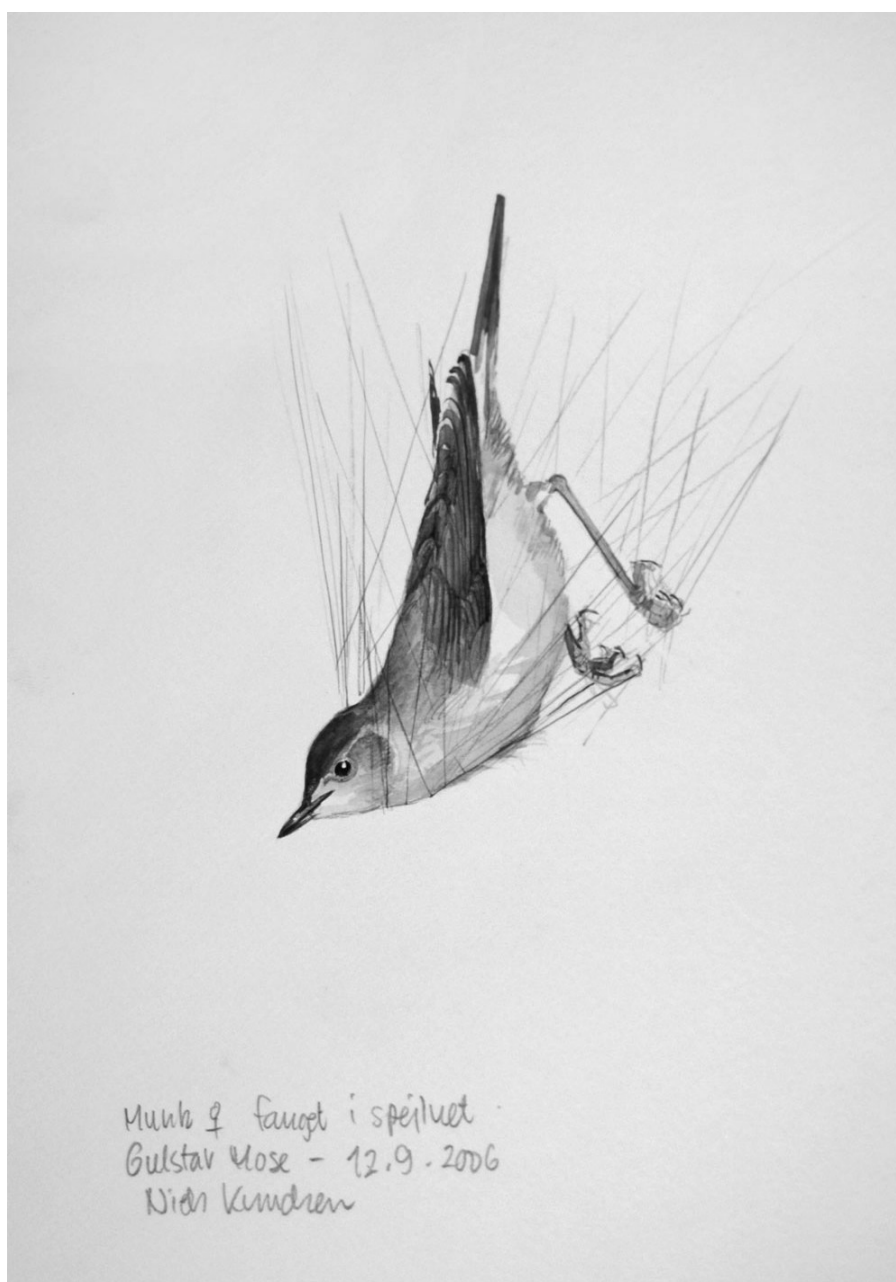
Munk fanget i nettet i Gulstav Mose. Tegning: Niels Knudsen.

Hold øje med pressen og/eller vores hjemmeside omkring annoncering af påskens udstilling.