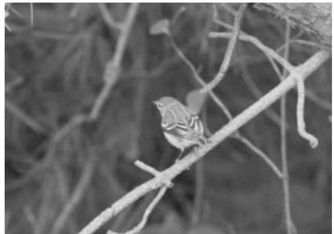
Stribet Sanger.

som TV2 dækkede begivenheden. Til lykke til Tim med den fornemme obs.