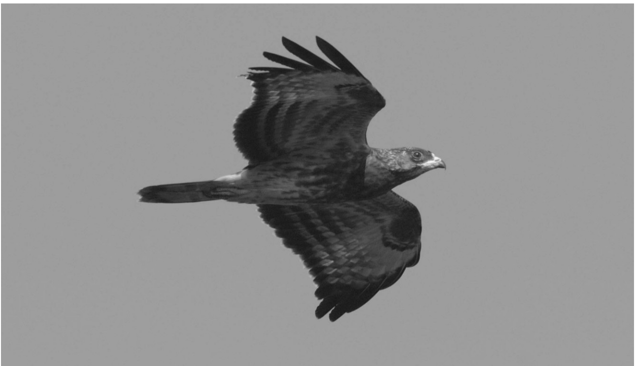
Hvepsevåge 1k, Dovnsklint.

Jeg har f. eks. i Langesøskoven kendt en rede i et træ, der stod lige ud til en befærdet bilvej, hvor biler, cyklister og gående passerede direkte under reden, da denne var bygget lidt fra stammen på en gren, der ragede ud over vejen. Fra denne rede kom der i en årrække unger på vingerne trods den ret intensive trafik under reden. Føden består hovedsagelig af hvepse og især disses yngel. Hvepsevågen udgraver de jordboende hvepses boer og bringer hvepsekagerne til reden.