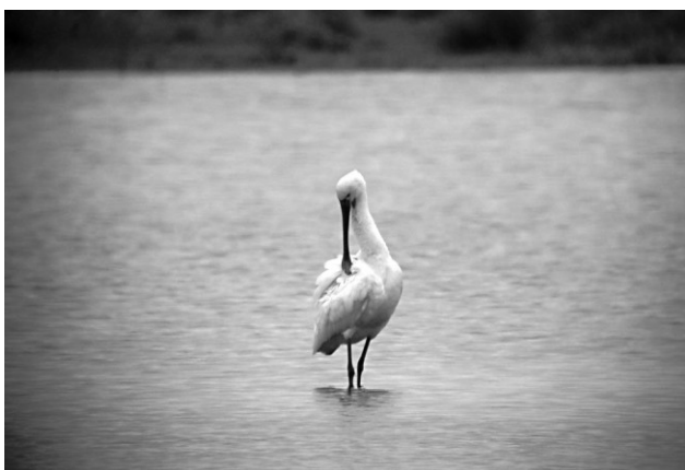
Skestork, Husby Strand, august 2002.

De gamle fugle er 4k eller derover og de har i yngledragten gult brystbånd, okkergul fjerprydelse. De gamle fugle har sorte ben, sort næb, der ser marmorert eller skællet ud med gul spids. Området med gult er lille, størrelsen af det gule område varierer fra fugl til fugl og kan kun bruges til at skelne fuglene indbyrdes. 2k fuglene og i meget sjældne tilfælde 5k og 6k kan have sorte skafter på nogle af svingfjerene eller små sorte spidser på håndsvingfjerene, men generelt er svingfjerene uden sort og fjerdragten forekommer hvid. Iris er kraftigt rød.