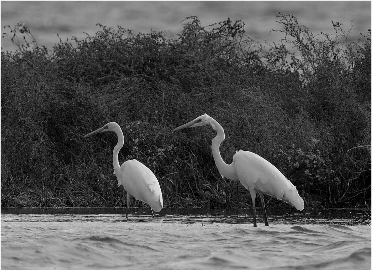
Sølvhejre, Thurø Bund.