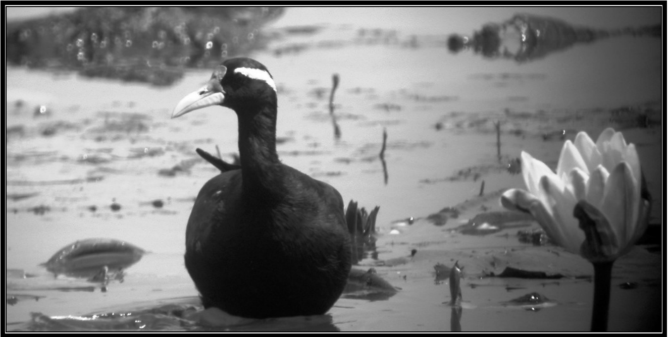
Bronze-winged Jacana én af de to talrige bladhønsarter ved Carambolim Lake