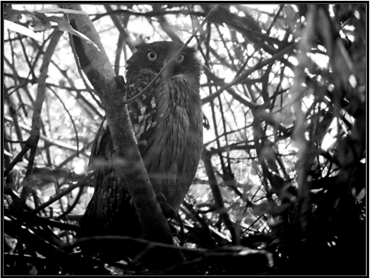
Brown Fish Owl ved Mayem Lake

ja endda et par frømundede, Sri Lanka Frogmouth, de næste par dage. Her er dog én, der blev opdaget af vores medbragte politi – uden at bestikkelse var involveret: