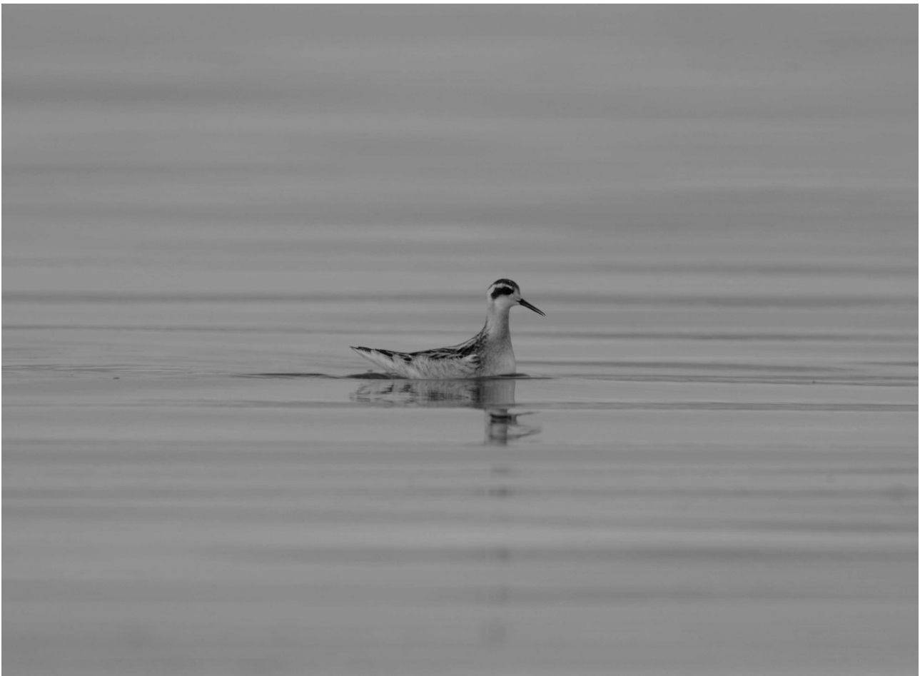
Odinshane, Keldsnor.

Arten ”invaderede” Danmark i mængder i august. I perioden 8/7-3/9 blev set ca. 25 individer i Fyns Amt. Max. Tal blev: 11/8, 17/8, 27/8 3 Keldsnor. 19/8 3 Tryggelev Nor. 16-9/8 5!!! Firtalsstrand.