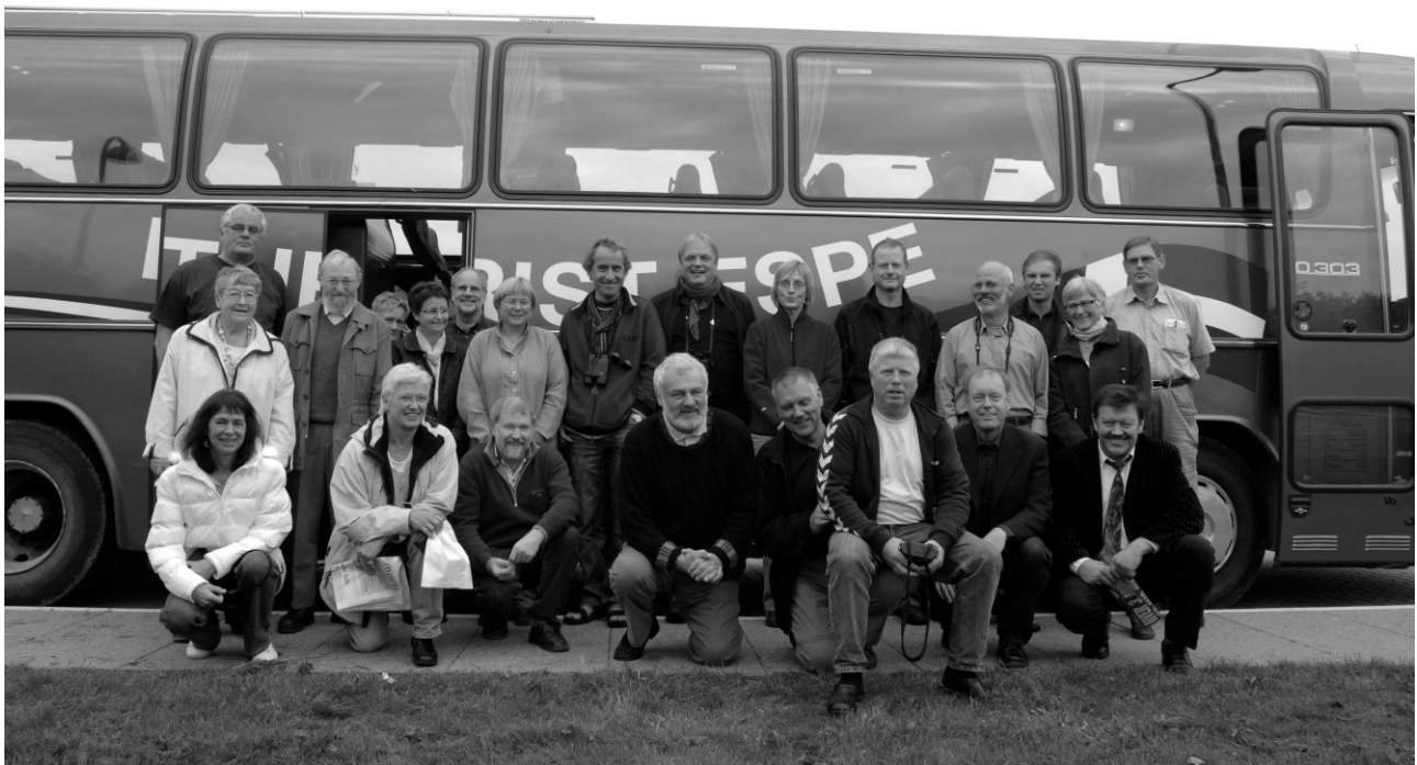
Deltagerne i jubilæumsturen.