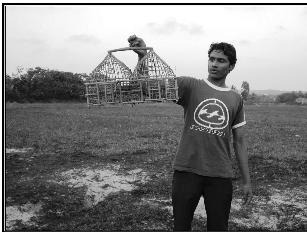
Vi blev opmærksomme på nogle fløjt, og så var der vagtler i kassen.