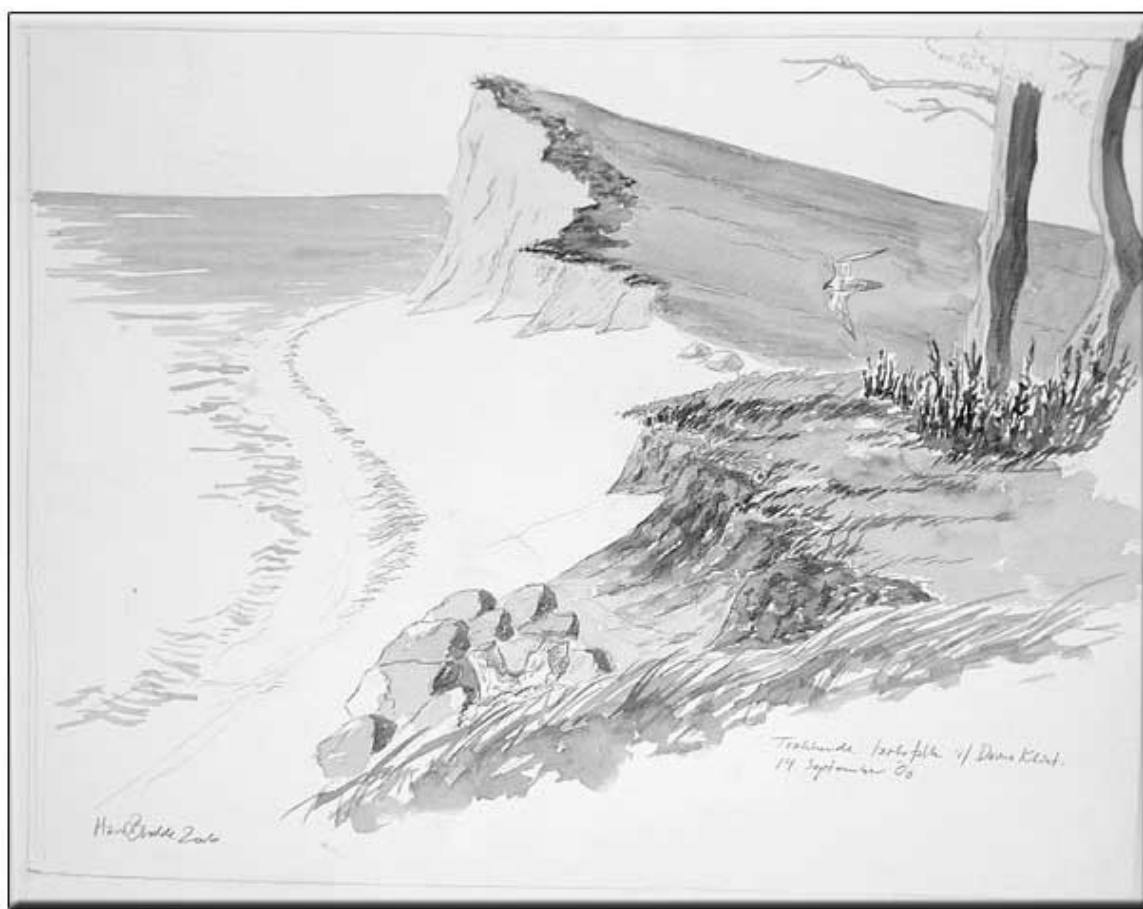
Lærkefalk ved Dovnsklint.