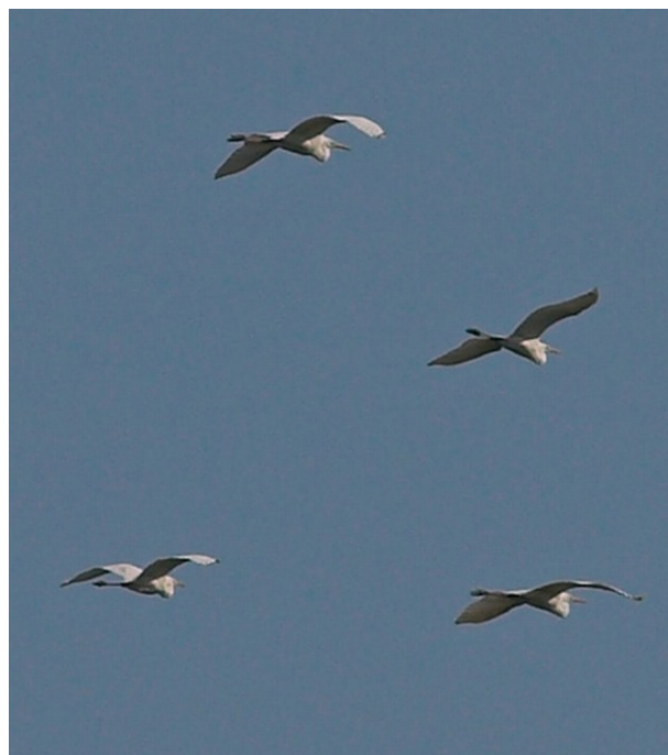
Sølvhejrer ved Vejlen, Tåsinge.

Vinterfuglen på Ristinge Hale blev set frem til 2/5.