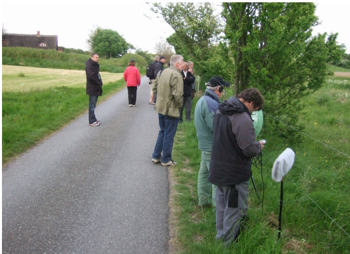
Der lyttes og optages.

sig på at tage hjem efter en lille øl for at fejre en ny art. En enkelt uheldig måtte tage turen fra Vestjylland to gange, før han fik hørt fuglen. Fuglen er i skrivende stund – den 11. juni – stadig i mosen, og følger sit sædvanlige mønster: Sporadisk syngende døgnet rundt, men mest aktiv morgen og aften. Det skal understreges, at det ikke er karakteristisk for arten, mange synger kun om natten. Den første dag – onsdag – var der skønsmæssigt 150 tilrejsende, og i alt har mere end 300 ornitologer besøgt mosen og glædet sig over en af de sjældneste fugle i mange år i ”Fyns Amt”.