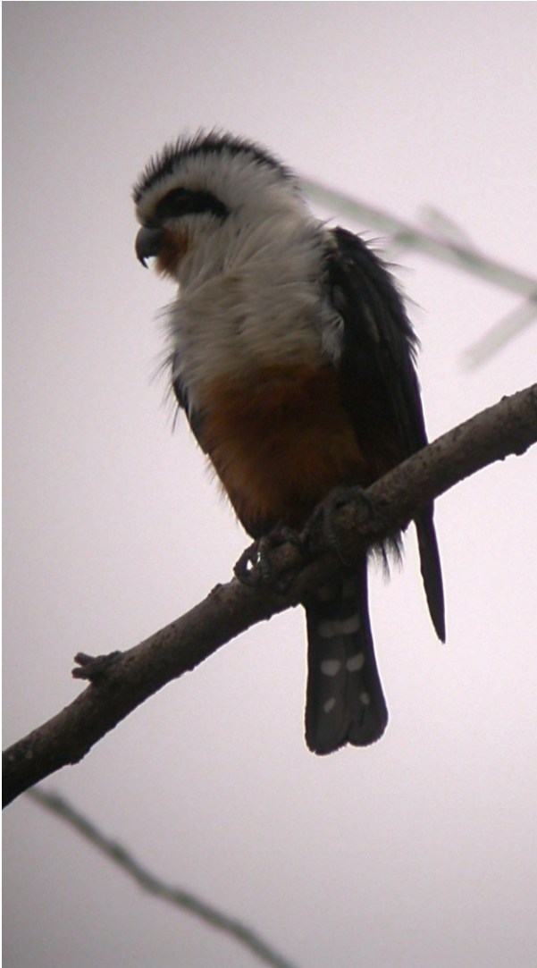
Halsbåndspygmæfalk er ikke større end en Vendehals

Der var et vældigt leben ved den flod. Et par Lille Adjudant (Lesser Adjutant) og enkelte Uldhalsstorke (Woolly-necked Stork) svævede over regnskoven, 5 Blå Glenter trak op ad floden, Store Pragtdrongoer (Greater Racket-tailed Drongo) fejede gennem luften med halen halsende bagefter, Skægparakitter (Red-breasted Parakeet) sørgede for, at der ikke var et øjeblik stilhed, og luften fyldtes med ét af mainaer, eksotiske støre,