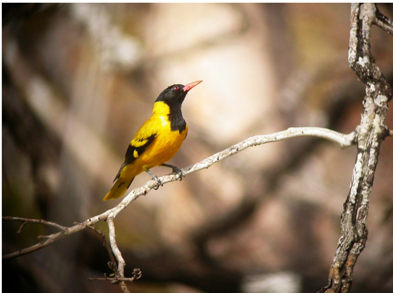
Oriental Hættepirol (Black-hooded Oriole).

Nå, det var de 307 arter, vi kom fra – men så skal vi som sagt ind i et fredet område. Efter en lang, sej køretur på 700 km, der startede i Ho Chi Minh Citys scooter-helvede og gik nordpå uden at bebyggelserne nogen- sinde syntes at holde op, havde vi kun scoret 19 arter, heriblandt 1 Landsvalle og nogle Skovspurve – ikke voldsomt eksotisk på 15 timer!