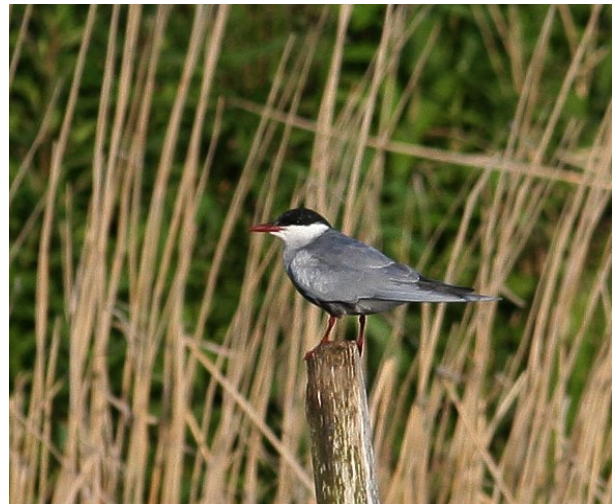
Hvidskægget Terne, Gulstav Mose.

ser/vandhuller. Det passede min kilometeren noget bedre, især da han kun var 10 minutter fra mosen! Ternen fløj om til sin favoritsø, hvor jeg kunne forevise den, og sorg var til glæde vendt. Efter en times tid tog ternen igen nord på – det samme gjorde jeg. Den vendte dog tilbage efter et par timer og blev i mosen dagen ud til glæde for mange, der nåede at komme derned. Næste morgen var den der endnu, men ved halv nitiden trak den væk, denne gang for alvor!