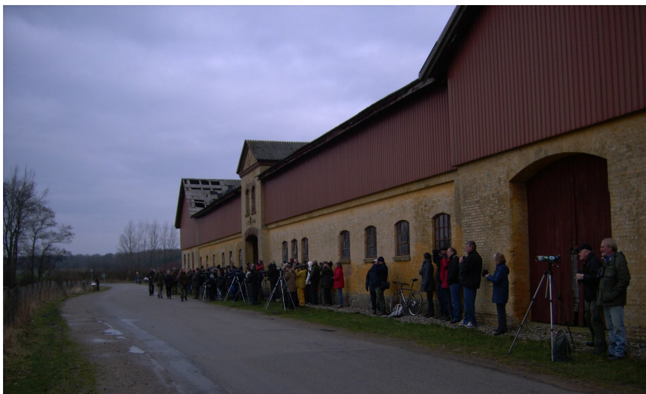
Gæster ved Ørnens Dag ved Brændegård Sø.

Kl.13.50 forsvandt ørnene så fra området. Det var samtidigt med at arrangementet skulle slutte, så det var et veltilrettelagt optrin ørnene gav os. Pressen var mødt talstærkt op med journalist og fotograf fra Fyens Stiftstidende og et filmhold fra TV2. Arrangementet blev godt dækket, med en foromtale i avisen, direkte radiointerview om lørdagen, en reportage i TV2 om aftenen og en stor artikel i Fyens Stiftstidende om mandagen. I alt blev Ørnens Dag her på Fyn besøgt af ca. 350 mennesker, som alle fik en stor fugleoplevelse.