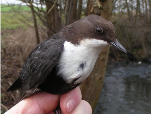
Vandstær, Hågerup Å.

get løst, idet fuglene ellers bliver kastet tilbage ud af nettet, og undslipper.