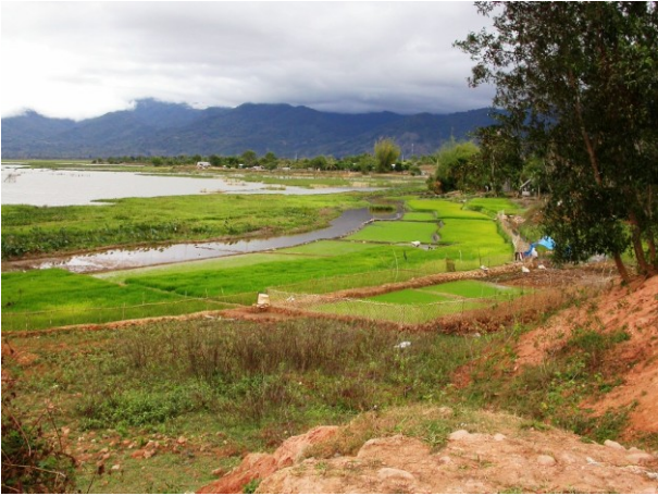
Lak Lake: En alt for sjælden kombi af arbejdende folk og fugle.

Indiske Dværgænder (Cotton Pygmy Goose) lå side om side med Atlingænder, purpurfarvede Sultanhøns dukkede op ad græsset, elegante Fasanbladhøns (Pheasant-tailed Jacana)