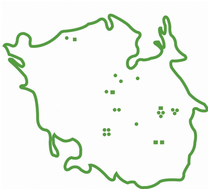
Aktuelle lokaliteter. Rund plet = ringmærkning. Firkant = aflæsning.

Størsteparten af vor viden om vandstærenes trækforhold stammer fra 1970-erne, hvor vandstæregruppen mærkede flere hundrede fugle hvert år. De seneste år er der blot mærket i størrelsesordenen 20-30 fugle årligt, størsteparten i Østjylland. Genmeldinger viser, at de vandstære, vi ser i Danmark, stammer fra det sydlige Norge. Nogle vandstære skifter lokalitet fra vinter til vinter, og der er eksempler på fugle, der har overvintret i Skåne en vinter og i Jylland en anden vinter.