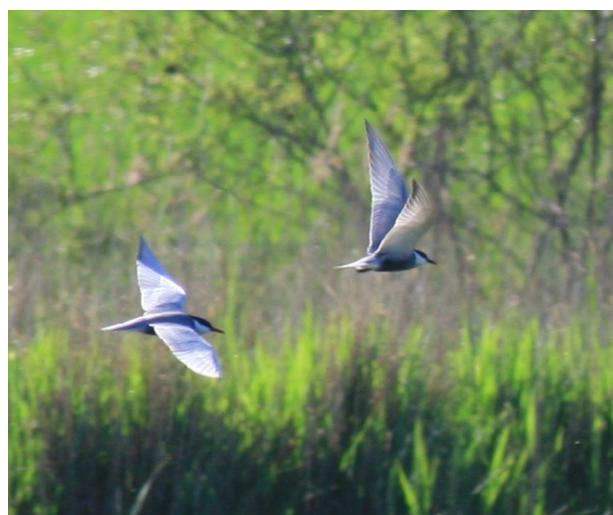
Hvidskæggede Terner, Vejlen.