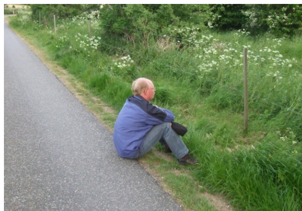
Sig nu noget!!

Vores brug af ordet ”mulig” var ikke noget, der afskrækkede folk, første udenøs gæst kom, da vi kørte, og i løbet af dagen var fuglen i perioder meget medgørlig. Den sang fuldstændigt, som Lars havde hørt det, især om morgenen, ved 14-tiden og ved