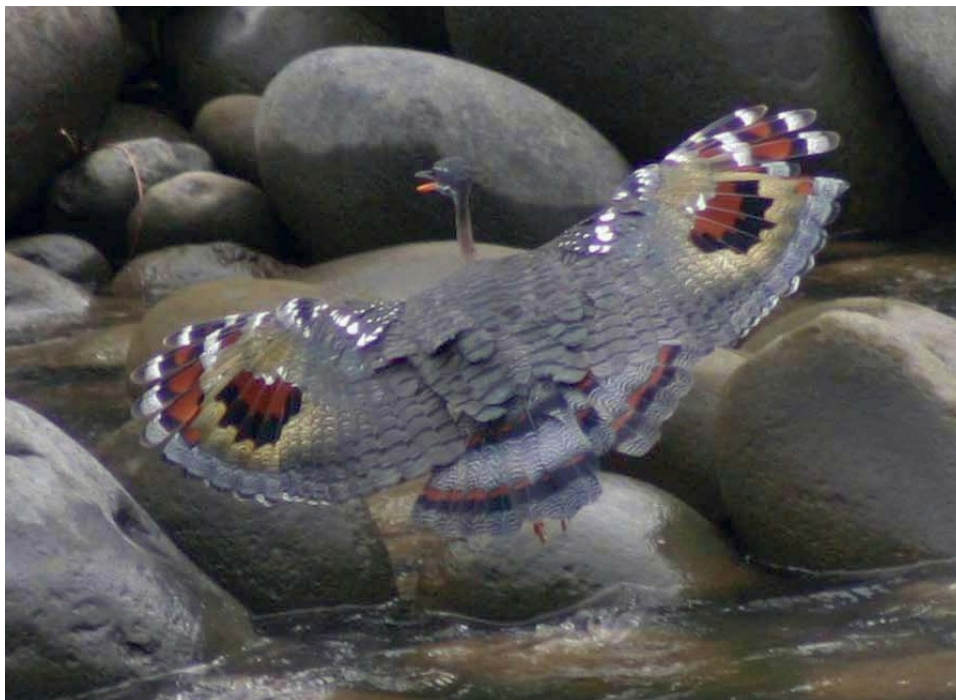
Sun Bittern.

Dansk rejseleder bliver Hans Ole Matthiesen, Odense, der flere gange har besøgt Costa Rica. Prisen vil formentlig ende på 19.000 kr. for fly, overnatninger, morgenmad og mange daglige måltider, dansk og costaricansk rejseleder, chauffør og transport til lands og