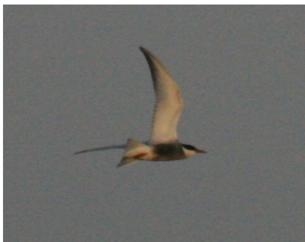
Hvidskægget Terne, Ølundgård.

nem. Martin ringer øjeblikket efter, og jeg får ham til at sørge for en ud-melding. Min far og jeg koncentrerer os nu om at følge ternen. Efter et stykke tid tager den pludselig lidt højde og forsvinder ned i den bagerste del af området..."shit" tænker jeg..."nu ryger den sgu af sted!"