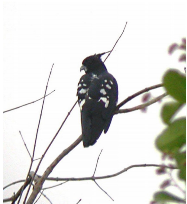
En af vores ønskearter: Sort Baza ved Mekong-floden

Efter en overnatning i Buon Ma Thout stod vi morgenen efter og beundrede den brune Mekong-flod, og ikke mindst endemet Mekongvipstjerten (Mekong Wagtail), som meget betegnende sad på en sten ude i floden. Det er en flot fyr, der ligner Havrevimpfen, men har kulsort ryg, kind og hagesmæk, kraftig hvid øjenbrynsstribe og et fornemt sort-hvidt vingemønster. Nationalparken Yok Don er enorm, strækker sig godt ind i Cambodja og har virkelig meget at byde på. Det var her, vi så et par af turens ønskearter: rovfuglene Halsbåndspygmafalk (Collared Falconet) og Sort Baza (Black Baza). Falken er ikke større end en Vende-hals og lynhurtig, når den drøner ned fra sin bambus efter en insektbid.