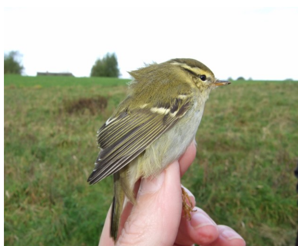
Hvidbrynet Løvsanger, KNF's anden.

Dansk Ornitologisk Forening, Fynsafdelingen.