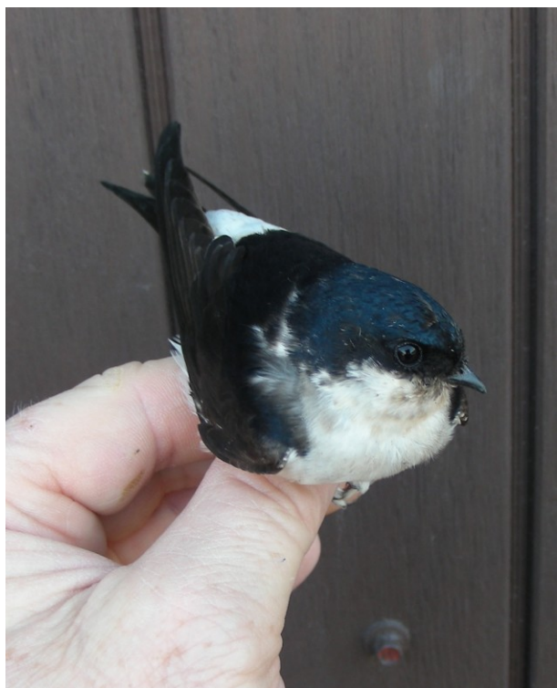
Genfanget Bysvale.

Landsvalerne holder til i kostalden, hvor de bygger rede oppe i lofts-konstruktionen. Der bliver aldrig benyttet fluegift i stalden, så der er gode fødemuligheder i form af fluer m.m..