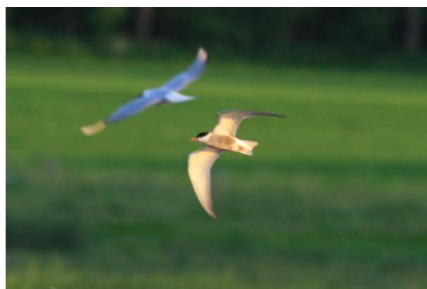
Hvidskægget Terne, Ølundgård.