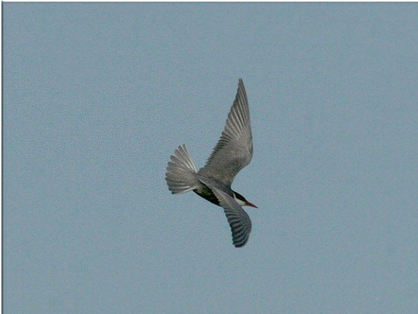
Hvidskægget Terne, Gulstav Mose.

rejsende ornitolog, og fortalte ham, at han godt kunne tage den med ro! Det passede ham ikke særlig godt, men der var ikke rigtig nogen at bebrejde, selv om han prøvede. Jeg fortsatte med at kigge på, hvad der nu var. Ved tolvtiden, hvor ternen havde været væk i mindst to timer, belavede jeg mig på at tage nordpå. Jeg ville dog lige tage en mad og en kop kaffe. Det gjorde jeg ved parkeringspladsen, for det kunne jo være, at den Lille Rørvagtel ville synge lidt igen. Det ville den ikke, men lige da jeg gik mod bilen, så jeg ternen komme ind i mosen nordfra. Den havde åbenbart taget sig en tur op i en af de nærliggende mo-