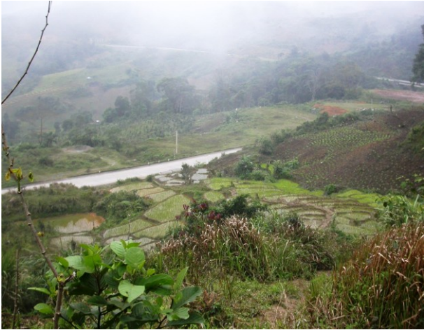
En dejlig smattet stejl risterrasse ved Lo Xo

lastbiler så at lave samme nummer med minibusser og alt, der i øvrigt er mindre end dem.