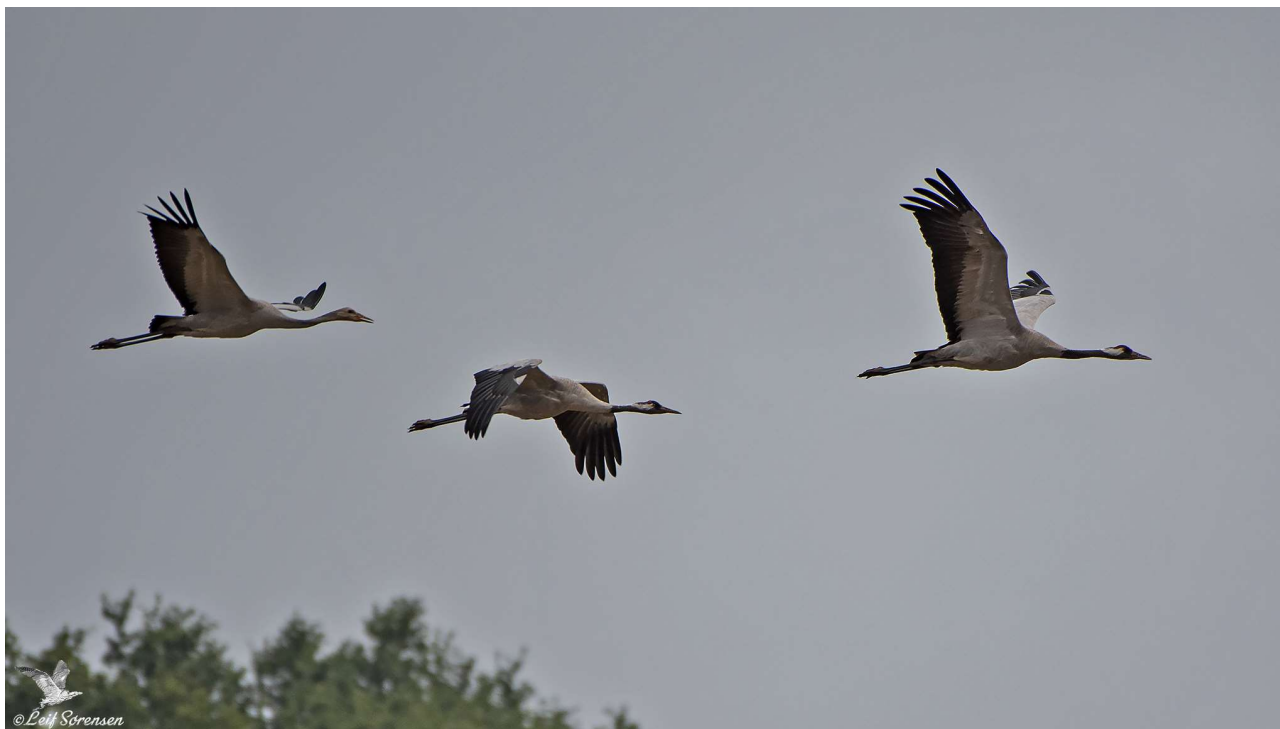
Traner. Det lokale ynglepar fra Lindkær med unge.

Om foråret er især Hornborgasjön i Sverige en kendt rasteplads, hvor op til mere end 20.000 Traner kan ses raste og æde. I de senere år er også området ved Kristiansstad, Pulken, blevet et kendt tranerastested. Begge steder fodres Tranerne med korn. Tranerne er her en stor attraktion, både for de lokale og for tilrejsende turister.