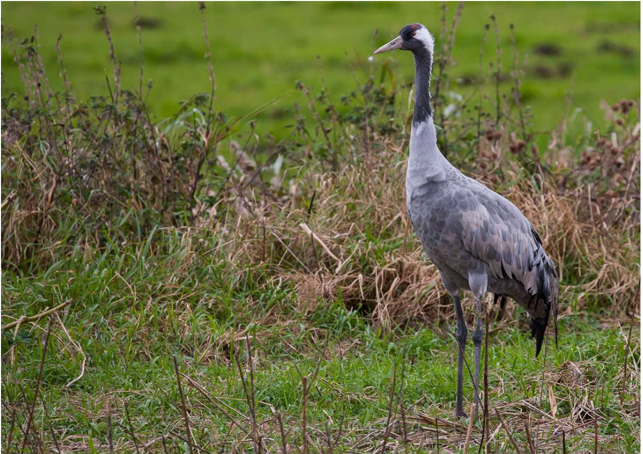
Trane. Tranens store silhuet er efterhånden ved at være et velkendt syn på Fyn. Alle billederne er taget lokalt og fortæller, at der også kommer unger ud af anstrengelserne. Den store fugl færdes meget diskret på ynglepladsen, men i træktiden føjes også dens højlydte trompeteren til oplevelsen.