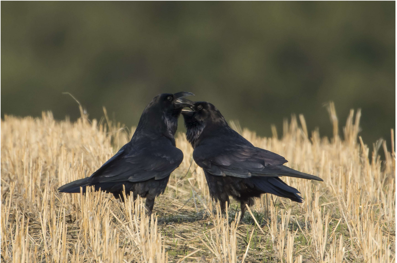
Ravn. Selvfølgelig ses Ravnene hyppigt ved Lindkær, som jo er en del af Ravnholt Gods. Faktisk ses de ofte i stort antal. Her har et par af Odins fugle sat hinanden stævne i en stubmark.

Trækfuglene. Lindkær med de store omgivende skove og marker ved Ravnholt, er et af Fyns bedste rovfugleområder. Det er ikke usædvanligt at se mange arter, især om efteråret. Et besøg i september kan godt give 10 rovfuglearter, f.eks. Musvåge, Hvepsevåge, Spurvehøg, Duehøg, Lærkefalk, Tårnfalk, Fiskeørn, Havørn, Rørhøg og Rød Glente.